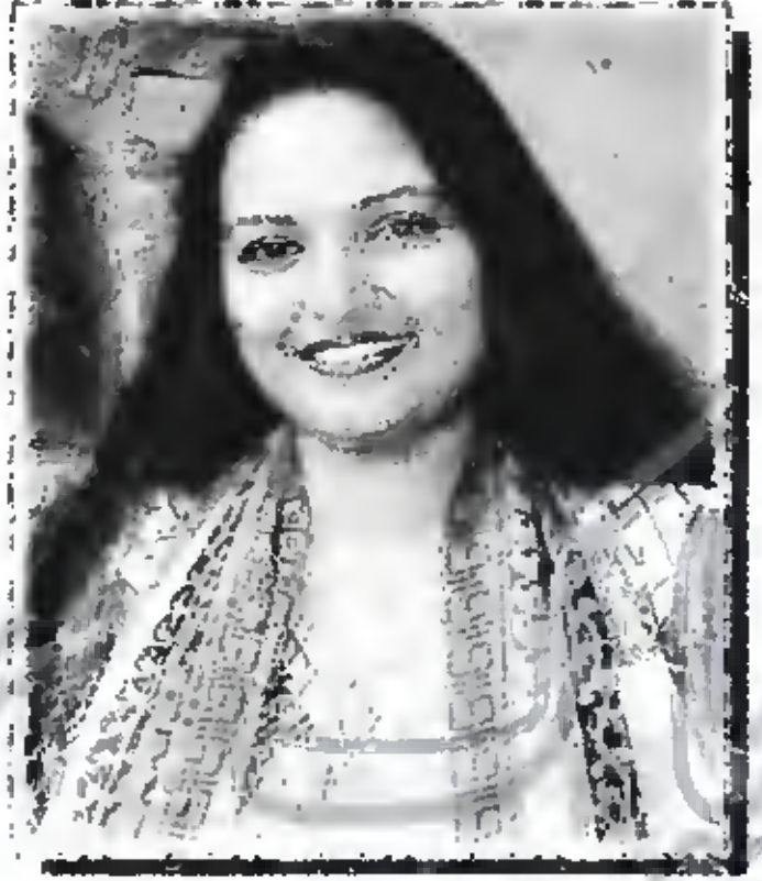
سارہ پیٹر (پاکستانی نژاد برطانوی گلوکارہ)